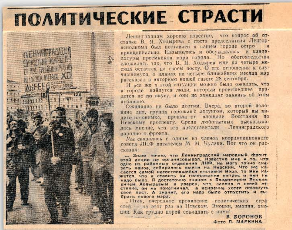
а) Выписка из протокола собрания участников группы поддержки ЛНФ Невского района г. Ленинграда.