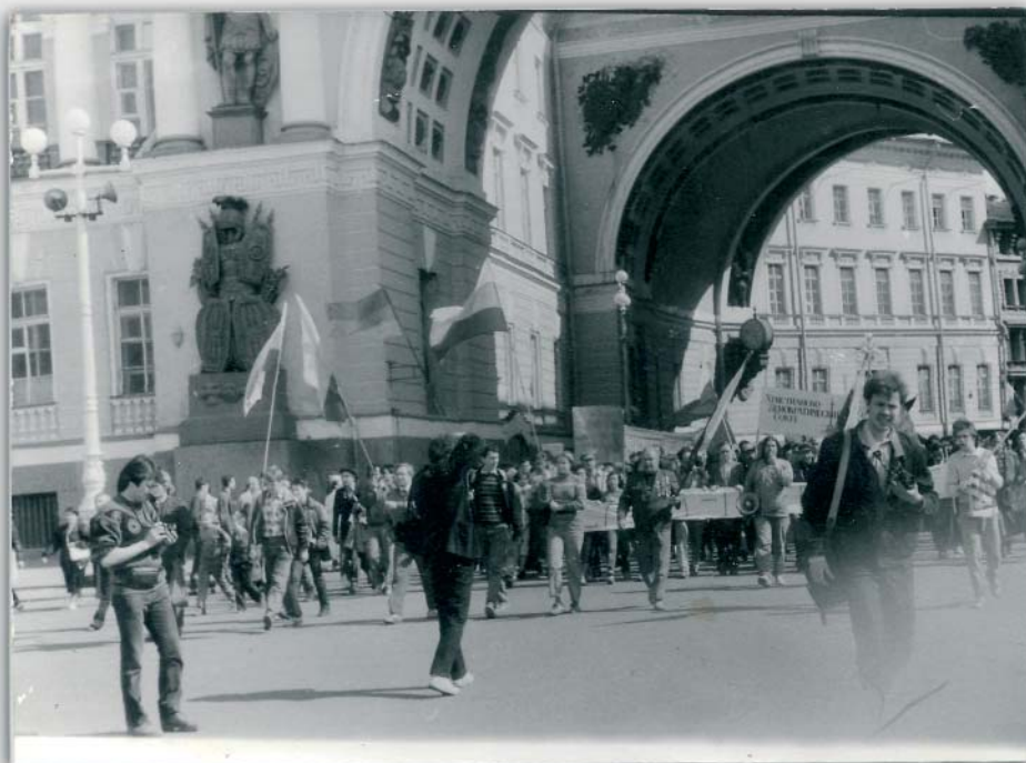
Демонстрация, организованная при участии ЛНФ, летом 1990 г. на маршруте Невский проспект — 18 Дворцовая площадь.